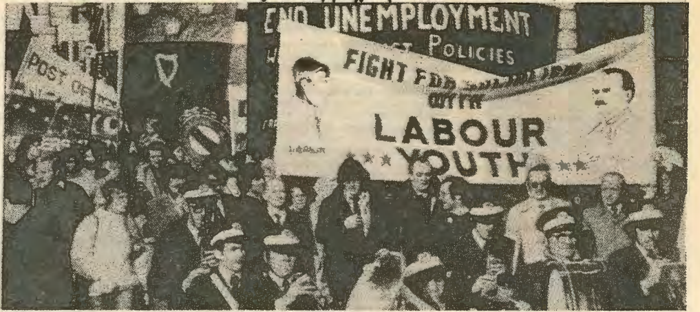
Διαδήλωση της Σοσιαλιστικής Νεολαίας ενάντια στην ανεργία.

λανδοί, θα αποδεικνύονταν ανήμποροι να σταματήσουν μια τέτοια εξέλιξη και τις βίαιες επιπτώσεις της. Οι Βρεττανικοί διατηρούν 9,000 στρατο. Οι προτεστάντες έχουν 22,000 οπλι-